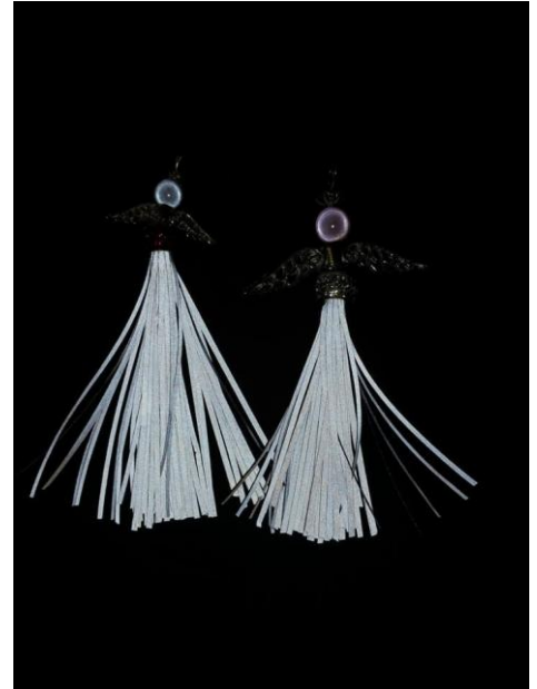
12. ...ja näyt paremmin pimeässä.

HUOM! Heijastava tuote ei korvaa oikeaa heijastinta, joka on CE-merkitty henkilösuojain.