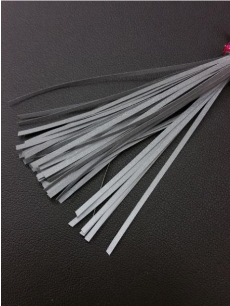
10. Leikkaa vyyhdin alareuna auki ja tasaa hapsu saksilla.