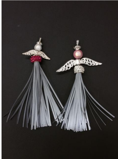
11. Kokeile erilaisia siipiä, pään kokoa, kruunumallia...